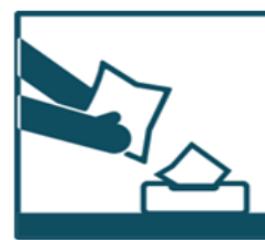
Пользуйтесь дезинфицирующими салфетками на спиртовой основе