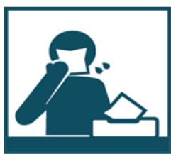
Пользуйтесь одноразовой бумажной салфеткой при чихании, кашле, насморке

Соблюдение следующих гигиенических правил позволит существенно снизить риск заражения или дальнейшего распространения гриппа, коронавирусной инфекции и других ОРВИ.