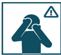
Не прикасайтесь к лицу немытыми руками