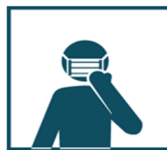
Пользуйтесь одноразовой маской