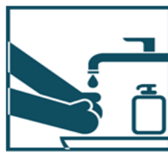
Чаше мойте руки