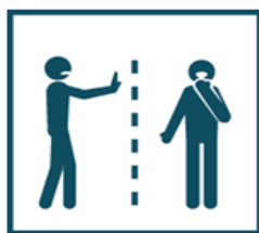
Ограничьте контакты с заболевшими людьми