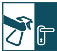
Влажная уборка дома ежедневно