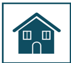
Оставайтесь дома в период массовых заболеваний